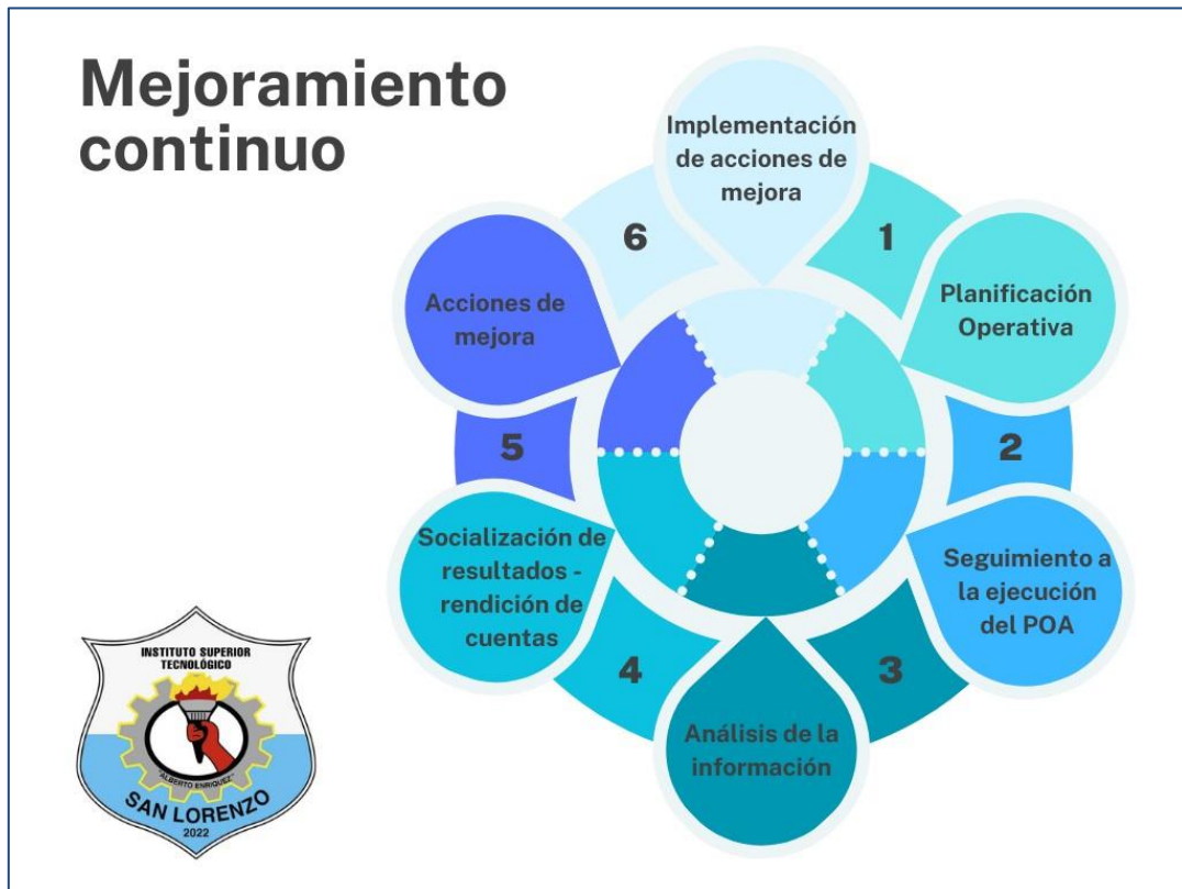
Figura 2. Proceso elaboración y ejecución del Plan Operativo Anual (Rectorado, 2024)